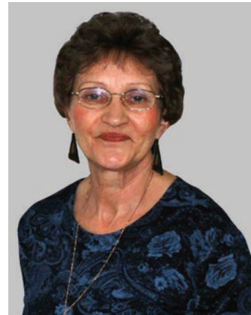
Dyrektor Oddziału w Mszczonowie

Serdecznie zapraszamy do naszej Filii w Żabiej Woli oraz do pozostałych placówek Banku.