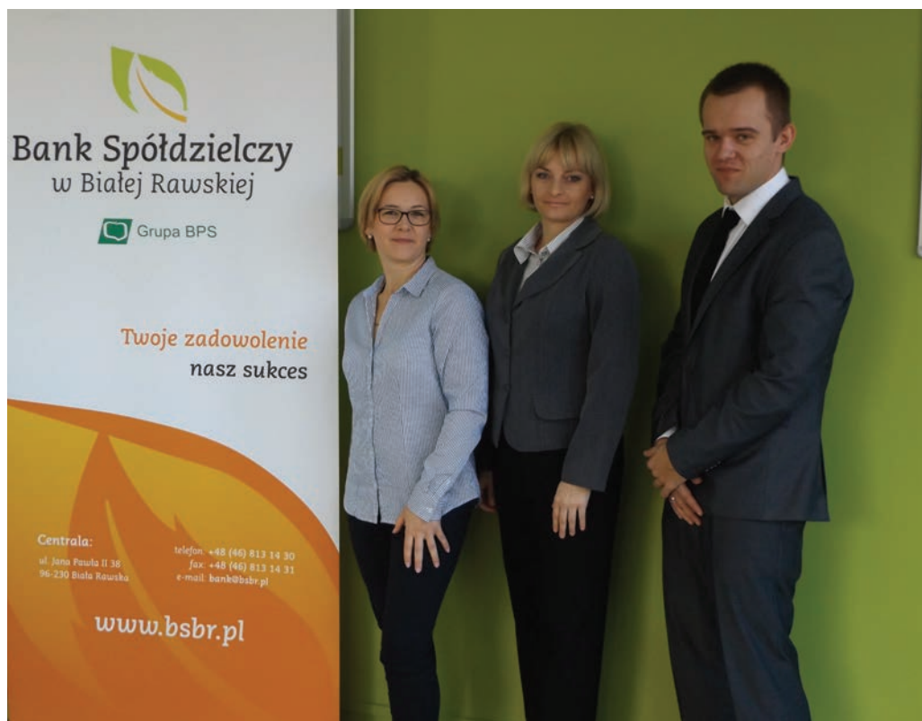
Pracownicy Filii w Żabiej Woli