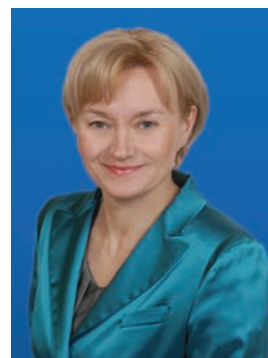
Wójt gminy Żabia Wola

Samorzady wyboru banku, który będzie obsługiwał ich rachunek, dokonują w trybie Ustawy o zamówieniach publicznych. Umowa z poprzednim bankiem wygasła z końcem października. Bank Spółdzielczy w Białej Rawskiej wygrał przetarg ogłoszony przez gminę przedstawiając najbardziej korzystną ofertę. Przez najbliższe pięć lat będziemy współpracować z tą instytucją finansową. Zналиśmy ten Bank już wcześniej, w niektórych aspektach z nim współpracując. Mam nadzieję, że dobre wcześniejsze doświadczenia będą kontynuowane. Jak widzę, placówka w Żabiej Woli, którą otworzył Bank, cieszy się dużą popularnością. Codziennie widzimy kolejne grupy osób, które chcą współpracować z tą Filią Banku. Mam nadzieję, że spotkają tam interesującą ofertę, a Bank z polskim kapitałem zadomowi się w Żabiej Woli.