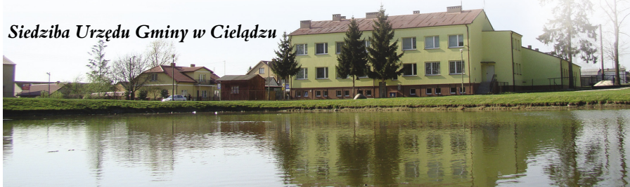
Siedziba Urzędu Gminy w Cielądzu