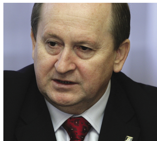
Krzysztof Pietraszkiewicz, prezes Związku Banków Polskich