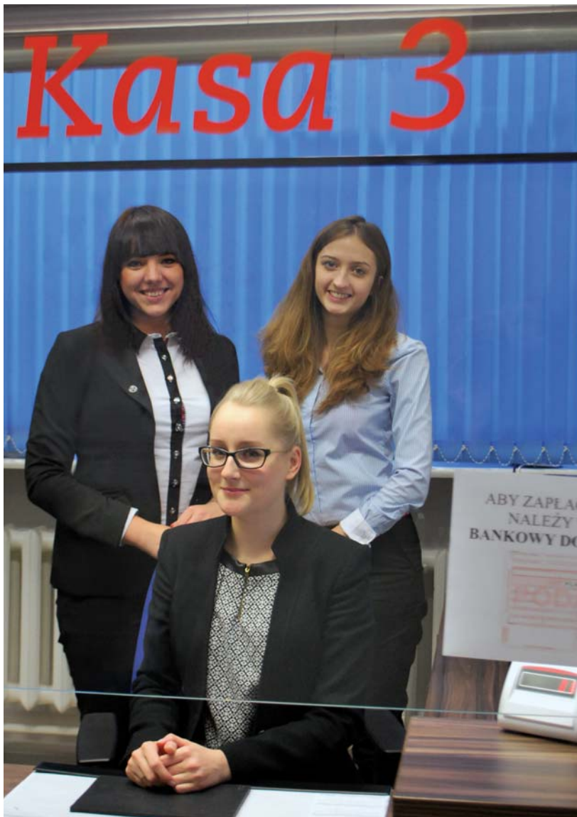
Pracownice Filii nr 1 w Warszawie

robiła dotychczasowa kasa Urzędów Skarbowych. Oprócz rozliczeń prowadzimy również pozostałą działalność bankową i promujemy naszą ofertę. Ponieważ Filię i Oddział dzieli zaledwie kilkuminutowy spacer, zapraszamy klientów zainteresowanych naszymi produktami do odwiedzenia Oddziału przy Alejach Jerozolimskich 85/U1. Również w tej placówce przyjmujemy wpłaty na rzecz Urzędów Skarbowych, zapraszamy do Oddziału komorników i innych klientów Urzędów – tłumaczy pani dyrektor – Do każdej osoby podchodzimy z najwyższym profesjo-