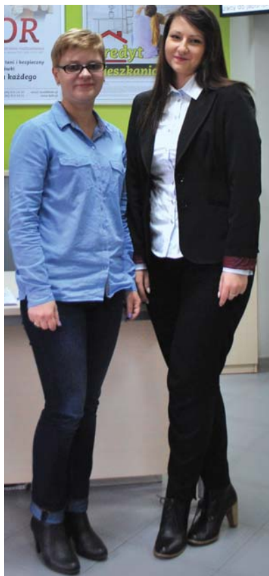
Pracownice Filii w Ujeździe

Gmina Ujazd położona jest w południowo - wschodniej części województwa łódzkiego w powiecie tomaszowskim. Zamieszkuje ją około 8 tys. osób. Bardzo aktywni są tutejsi przed-