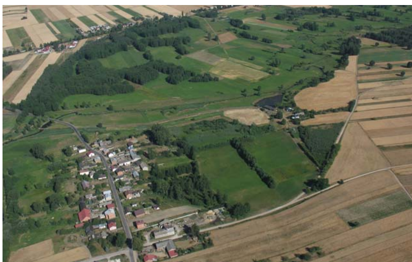
Gmina Rawa Mazowiecka widziana z lotu ptaka