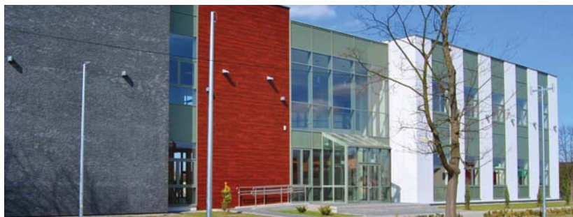
Nowy budynek Urzędu Miejskiego w Tarczynie z placówką POB Banku

Bank Spółdzielczy w Białej Rawskiej wychodzi naprzeciw potrzebom swoich klientów, otwierając nową placówkę w Tarczynie.